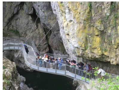
Grotterne Skojan Caves:

Vi var også et smut i byen Piran, som ligger i Slovenien. Her var nogle ude at få en dukkert i havet, det var virkelig koldt.