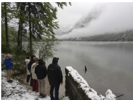
Gåtur ved Hostel Pod Voglom

Vi rejste i tog derved og hjem, hvor der blev hygget, snakket, grint, spillet davoserjas og nogle fik sovet i nattoget.