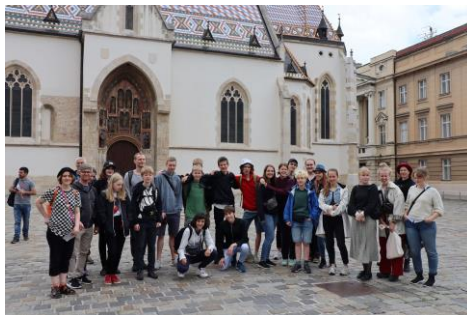
Kroatien ved Lego kirken

Da vi havde været i Zagreb en dag, tog vi toget videre til Hostel Pod Voglom i Slovenien. Der fik vi os en overraskelse, der var nemlig sne. Det var alle ikke helt forberedt på, men det var en sjov oplevelse. Frem kom vi til det Hostel i snevejret, vi fik indkvarteret os.