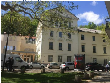
Steiner skolen i Ljubljana

Om aften blev der spillet en masse kort, pool, bordfodbold og grint en masse. Det var så hyggeligt.