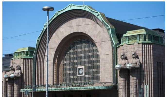
Du kan spørge en fra overskolen om de kender denne bygning, og måske er der en som kender arkitektens navn? / Duncan