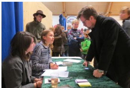
Billetsalg til fredagssalon

Send eller ring med indlæg, ris, ros og kommentar til din ansvarshavende redaktør Duncan Lithgow duncan.lithgow@gmail.com 50 57 02 05