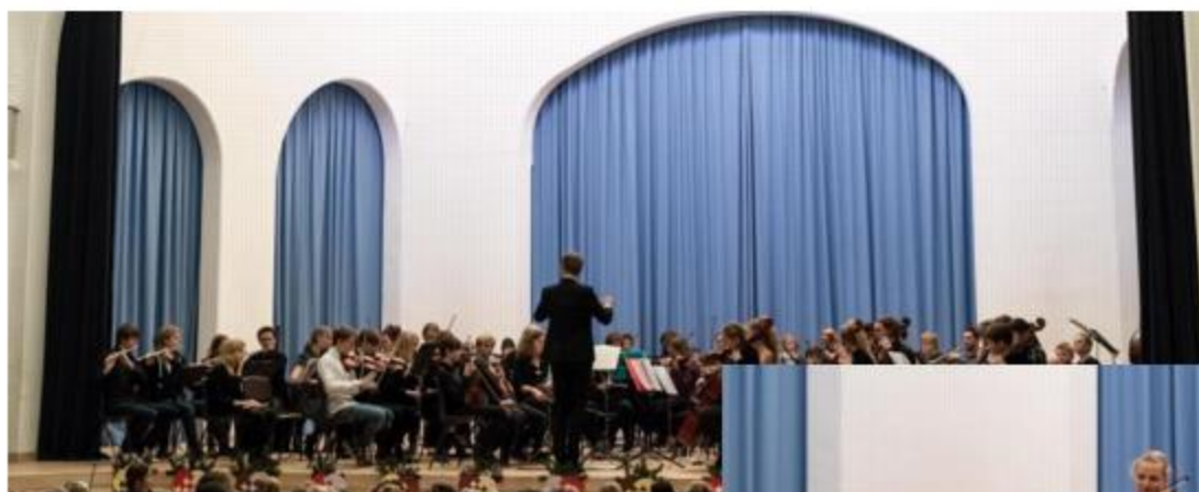
Skolens dygtig orkester åbner koncerten