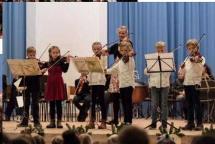
Debutkoncert for 3. klasse