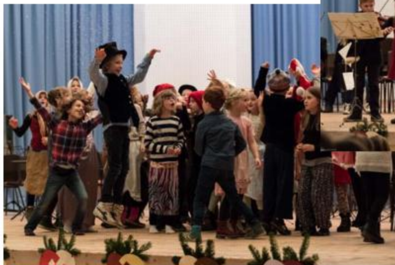
2. og 3. klasse synger Jul i Gammelby