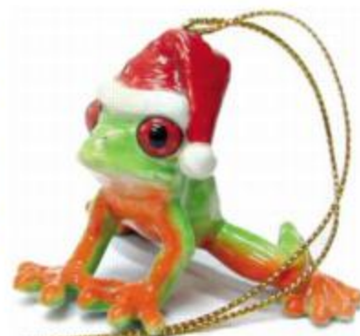
Duncans bud på Bets julegave for stein erlebe og skademere