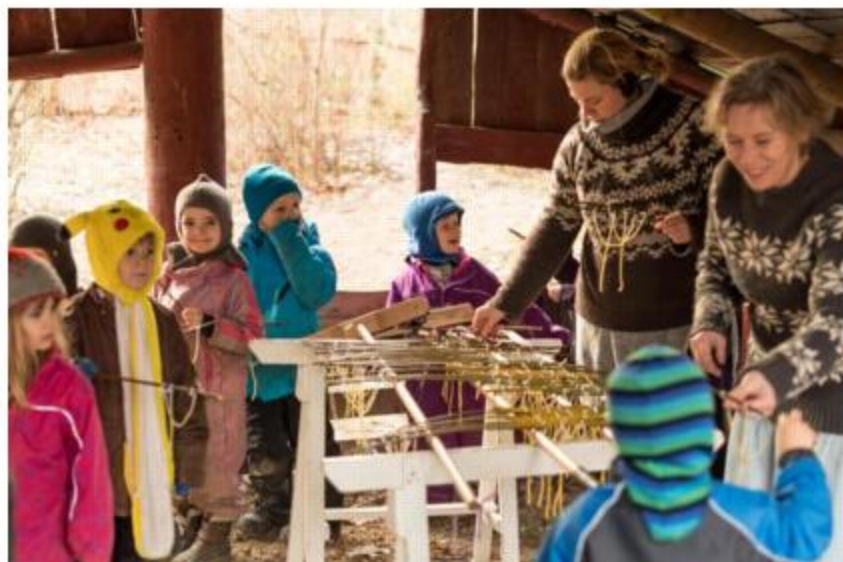
Freddag støbte børnehavens ældste børn hellige tre kongers lys i bivoks. De støbte både til sig selv og til resten af børnehavebørnene.