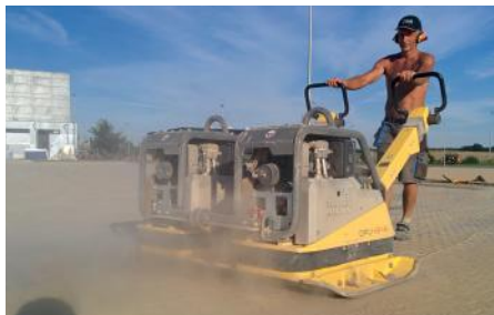
Det er hårdt arbejde at gøre rådhusets p-plads klar. Dette er ikke et oktober billede kan du nok se! / Duncan

GRØNNEDALSVEJ 16 8660 SKANDERBORG TLF 86 51 19 81 SE MERE PÅ VORES HJEMMESIDE WWW.RSS8660.DK