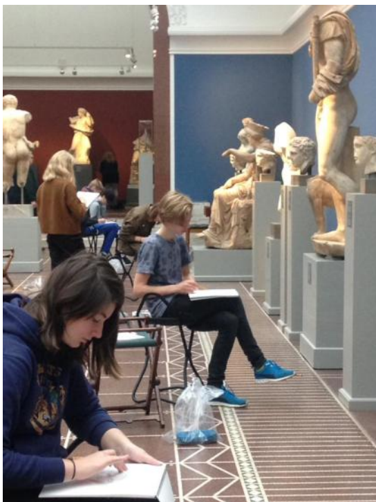
Niende klasse studerer ægyptisk billedhuggerkunst på Glyptoteket i København.

Stig / Tak til Iben samt forældre i 6. kl.